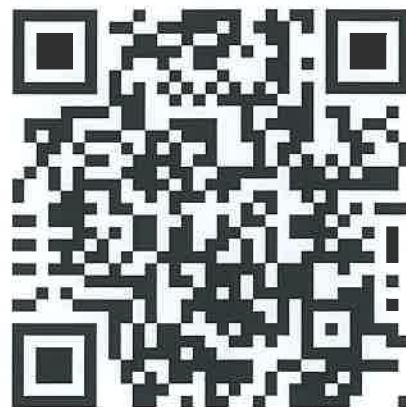
论坛微信群二维码